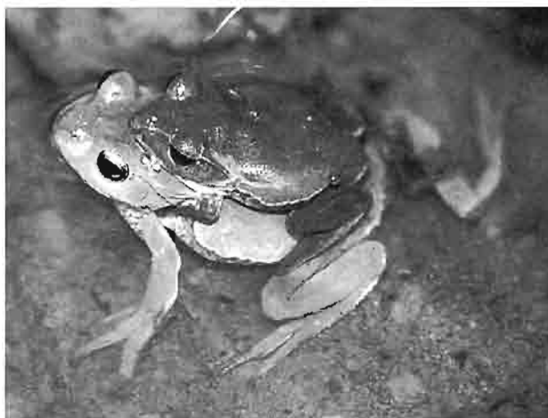
写真4 シュレーゲルアオガエル

シュレーゲルアオガエル(写真4)もこれらの種類に次いで分布確認が多かった。主な確認地点は川島、越畑、遠山、吉田、広野、將軍沢、杉山、西古里、千手堂であった。また分布確認の方法では、5月から6月の繁殖期に集中して水田に集まる繁殖個体を探索し町内の各地を巡回した。成体の目撃など効果的な生息確認の方法は特徴的な卵塊の確認と鳴声のききとりであった。鳴き声は、テープレコーダー等の録音機器を使用し、本種らが鳴き交わす声を確認する方法である。また個体が目撃された水田や池沼は、その背景や周囲に雑木林が存在する環境であった。このような場所ではまた、トウキョウダルマガエルも確認された。両種は比較的似た環境にみられたが、シュレーゲルアオガエルはより周囲の開けた平地的な環境に確認できた。トウキョウダルマガエルは周囲や後背地に山林があるような場所、谷津の水田や池沼にみることができた。