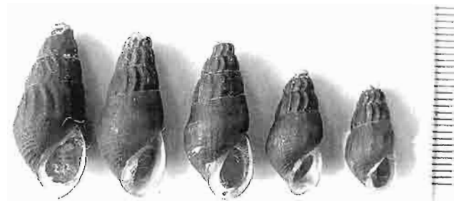
写真8. ヒダチチリメンカワニナ