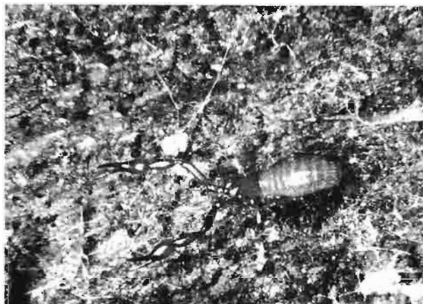
アカツノカニムシ♀ 嵐山町吉田。1998.2.14。