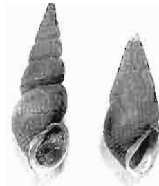
写真6. カワニナの殻形変異 (左)