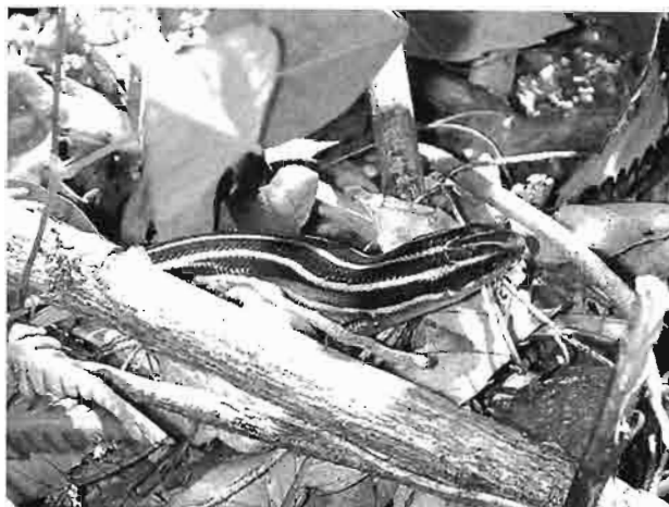
写真1 ニホントカゲ(大平山)

トカゲ類では、ニホントカゲ(写真1)の記録が少なかった。本種も近年、生息地や個体数の減少が危惧されており、今回の野外調査でも目撃例が少なかった。町内では勝田や將軍沢、大平山山麓などで記録された。