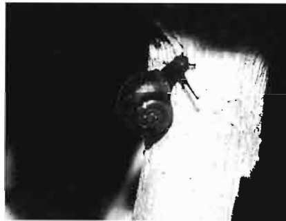
写真4. カントウピロウドマイマイ