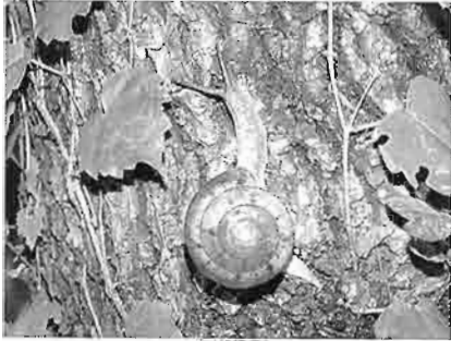
写真1. コベソマイマイ