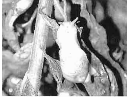
写真2. オカモノアラガイ