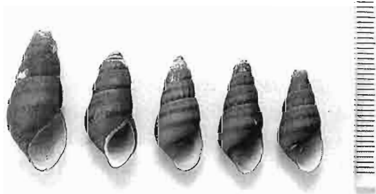
写真7. ミズジカワニナ