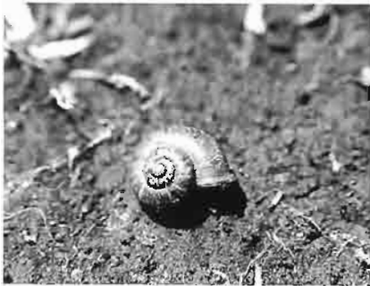
写真3. アツブタガイ