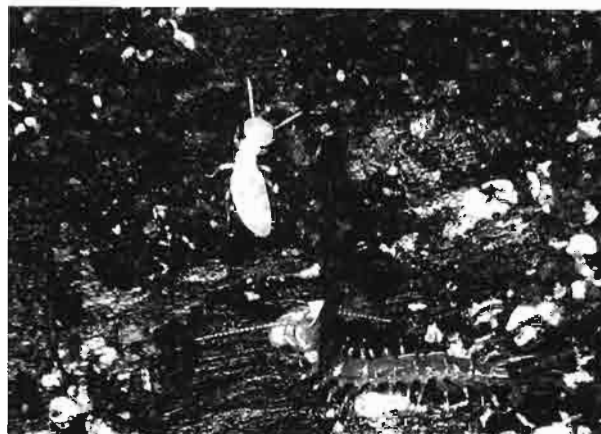
本シロアリを捕食中のイッシンムカデ(若虫) 1998.5.9 将軍沢(高城)アカマツ樹皮下

♀,1997.5.10; 2♂1♀,1999.10.25:(菅谷館跡) 1♀,1996.11.14; 1♂,1997.1.11; 1♂1♀,1997.2.9, TN; 1♀,1997.4.12; 4♀,2001.4.14. 杉山: 2♀,2001.1.13, SU:(杉山城跡) 2♀,1998.11.14:(裏猿外戸) 1♂1♀,1999.5.8. 千手堂:(大平山) 1♀,1997.2.9:(山の神) 1♂,1997.8.1:(春日神社) 1♂3♀,1997.5.10. 太郎丸:(午) 1♀,1998.1.25:(御堂山) 2♀,1998.5.9. 遠山:(寺山) 3♂1♀,1996.10.27. 平沢:(深山) 1♂1♀,1999.1.9:(赤井) 1♀,1999.1.9, SU. 広野:(大野田) 1♂1♀,1999.6.12. 古里:(柏木沼) 1♀,1997.11.8:(御獄神社) 1♂1♀,1997.12.13:(兵執神社) 2♀,1997.12.13. 吉田:(高山) 1♀,1998.2.14:(手白神社) 3♂,1998.2.14; 2♂1♀,1998.8.8:(天神台) 3♂2♀,1998.1.25.