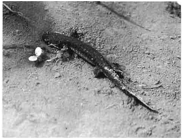
写真3 トウキョウサンショウウオ（將軍沢）

このように、本種の主分布地といわれている台地・丘陵帯や低山帯の生息地や生息個体数の減少が危惧されていることから、今回の調査によって確認された各地の生息地は注目に値する。