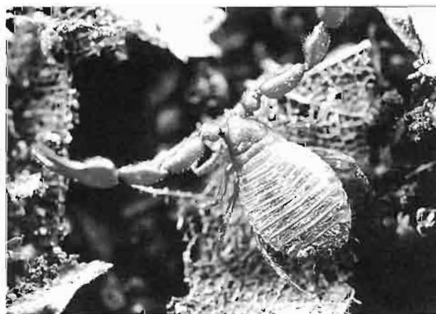
オオヤドリカニムシ♀ 嵐山町菅谷。2000.11.28。

大型種で腹部が幅広く目立つ。無眼。北海道から沖縄まで分布する。他のカニムシ類と同様土壌性であるが、本種は洞窟や動物の巣などにも生息することが知られている。