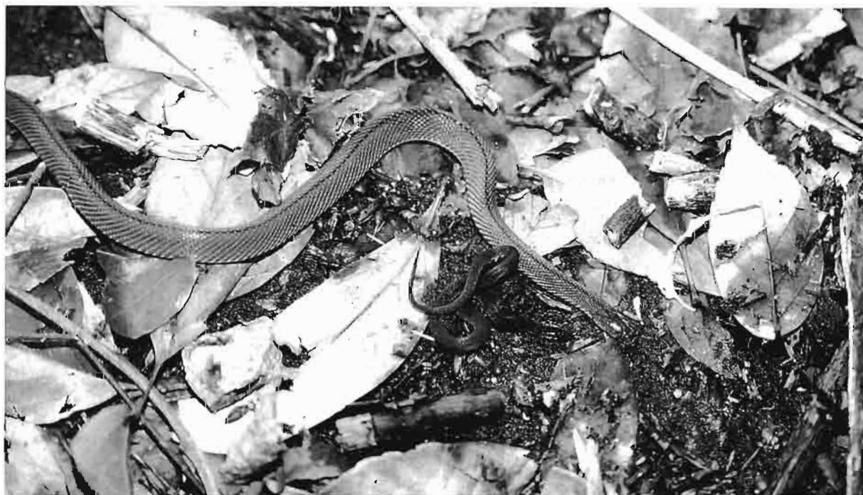
写真2 タカチホヘビ(遠山)

他の種類ではタカチホヘビ、シマヘビ、ジムグリ、アオダイショウ、シロマダラ、ヒバカリ、マムシが確認された。これらの中で特に目撃例が少なかったのはタカチホヘビであったが、遠山での2000年5月20日の調査では、低山麓の堆積した落葉下に成蛇、幼蛇を同一場所で確認した(写真2)。幼蛇は黒色味が強い体色をしていた。他の地域では吉田地区において確認できた。本種は、町内の山地的な環境を主に生息すると推測できるが、夜行性で、日中は石や朽木下、落葉下などに潜むため目撃例は少なかった。一方、シロマダラ、ヒバカリ、マムシの記録も少なかった。マムシは現地調査でも目撃は少なかったが、地元の人からの聞き取りでは知名度が高く、具体的な日時は不明であったが、過去の目撃例は各地で聞かれた。本目録では地元の人への写真による聞き取りで裏付けされた事例を記録した。アオダイショウは他種に比較して人家周辺でも目撃された。