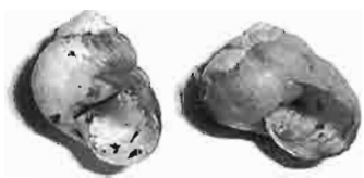
写真5. ウスカワマイマイの殻形変異 (左)