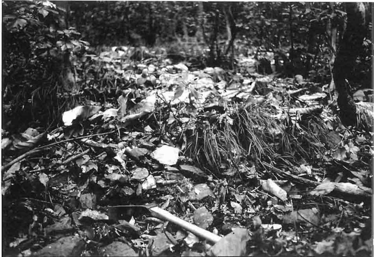
図1. ガロアムシの生息が確認された遠山地区の環境